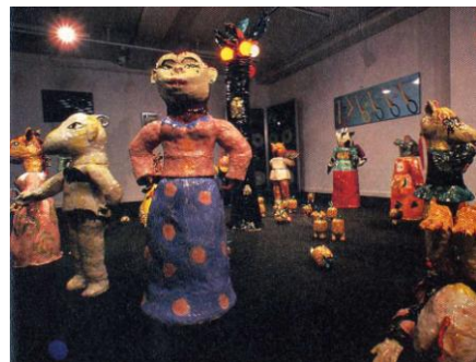
図 15 堤展子 『NOBUKO'S 十二支』 1985年