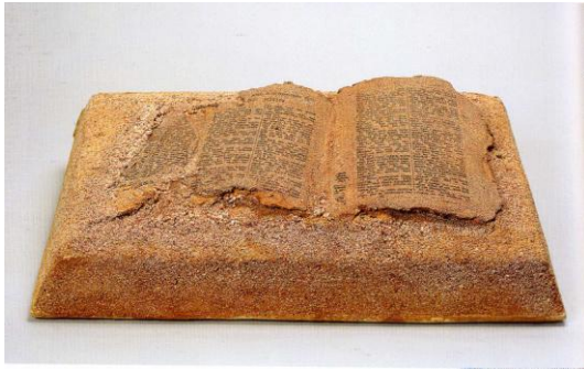
図 12 荒木高子 『砂の聖書』 1983年