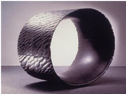
図 14 秋山陽 『準平原 872』 1987年