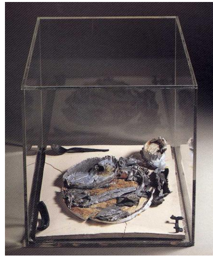
図10 西村陽平『伝道の書II』1975年