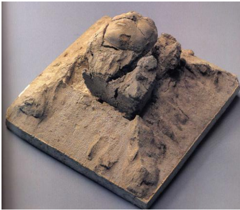
図9 鯉江良二『土に還る』1971年