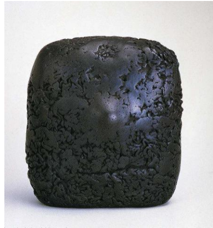
図6 八木一夫『盲亀』1964年