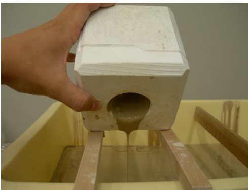
3 余分な泥漿を排泥する