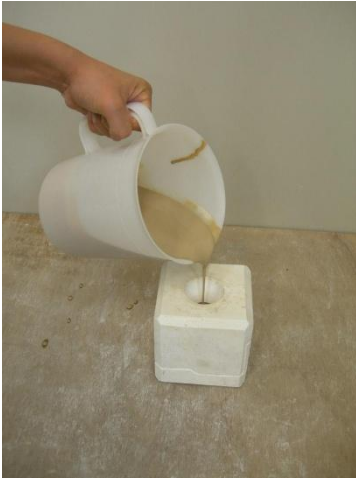
1 泥漿を石膏型に流し込む