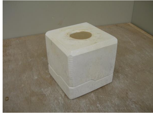
2 型に接した泥漿が徐々に固まり、素地に厚みができる